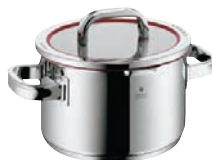
⑥WMF ファンクション4 ハイキャセロール