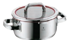
⑦WMF ファンクション4 ローキャセロール