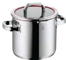
⑤WMF ファンクション4 ストックポット