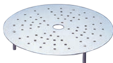
③スチームプレート F-ST